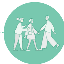
Ouverture sur l'autre