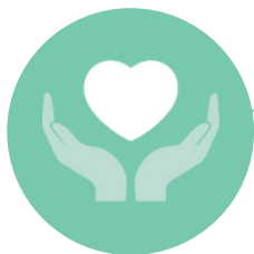
Responsabilité & solidarité